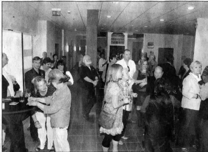
Gäste und Teilnehmer des Projektes „Ein Meer an Kunst“ im großen Foyer in der Stadtverwaltung III.

Er selber bekannte, dass er besonders beeindruckt sei von der reliefartigen Arbeit der Gruppe der Ostfriesischen Be-